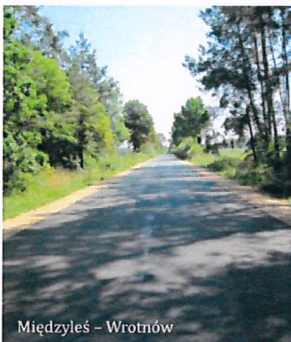
Międzyzyle - Wrotnów