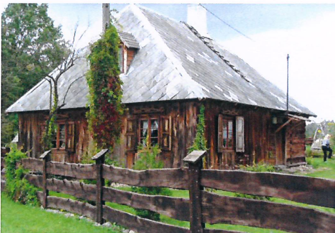
skansen w Sikorach