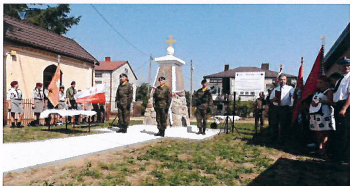
pomnik w Sikorach

przeszkody naturalne oraz sztuczne typu ściany, opony, okopy oraz wieżyczki.