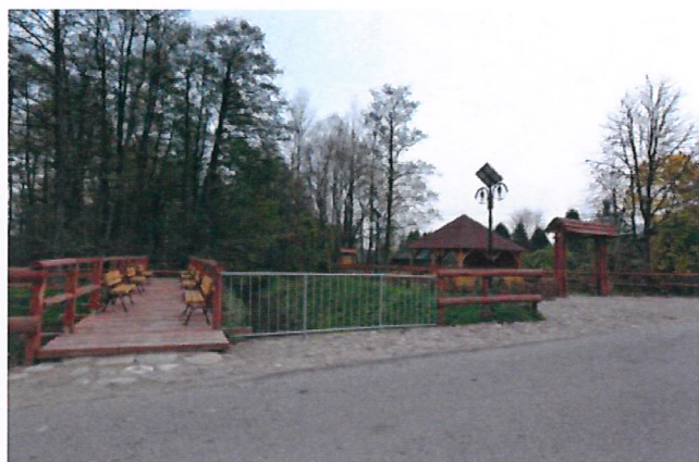
Bielany zbiornik wodny