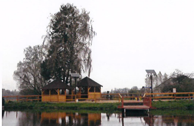
Kowiesy zbiornik wodny

Znajdują się tu wyznaczone ścieżki rowerowe a turyści mają możliwość