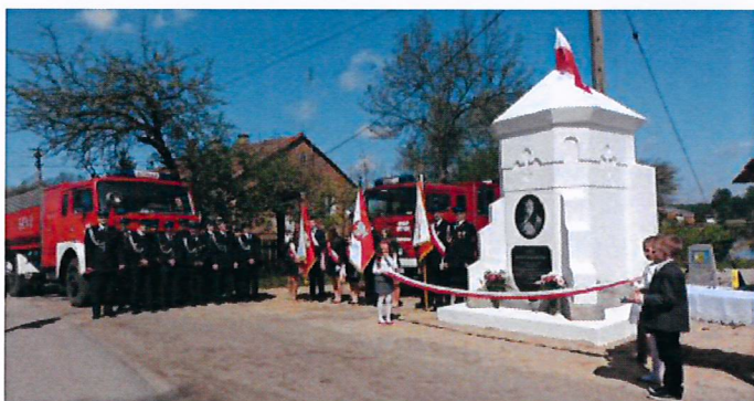
pomnik w Paczuskach