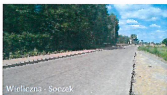
Wieliczna - Soczek

W bieżącym roku Powiat Węgrowski planuje złożyć wnioski o dofinansowanie odcinka drogi po-