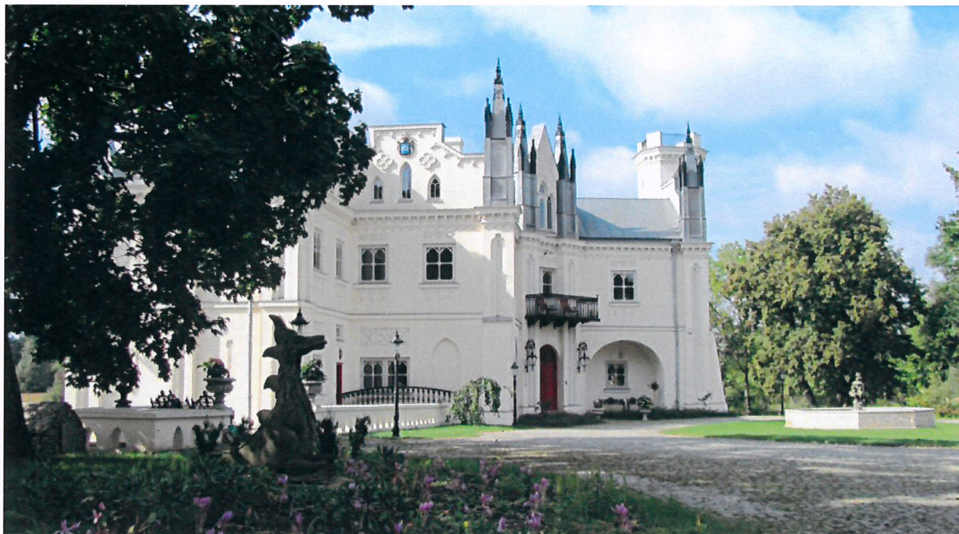
Pałac w Patrykozach