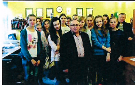
Beneficjenci projektu z wizytą w redakcji „Tygodnika Śiedleckiego”