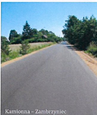
Kamionna - Zambrzyńc

mają do 30 września br. Droga powiatowa Grabowiec – Stoczek stanowi dogodny dojazd do drogi krajowej nr 50 Ostrów Mazowiecka – Łochów – Grójec oraz do stacji kolejowej znajdującej się w miejscowości Ogrodniki. Bezpośrednio przy przebudowywanym odcinku