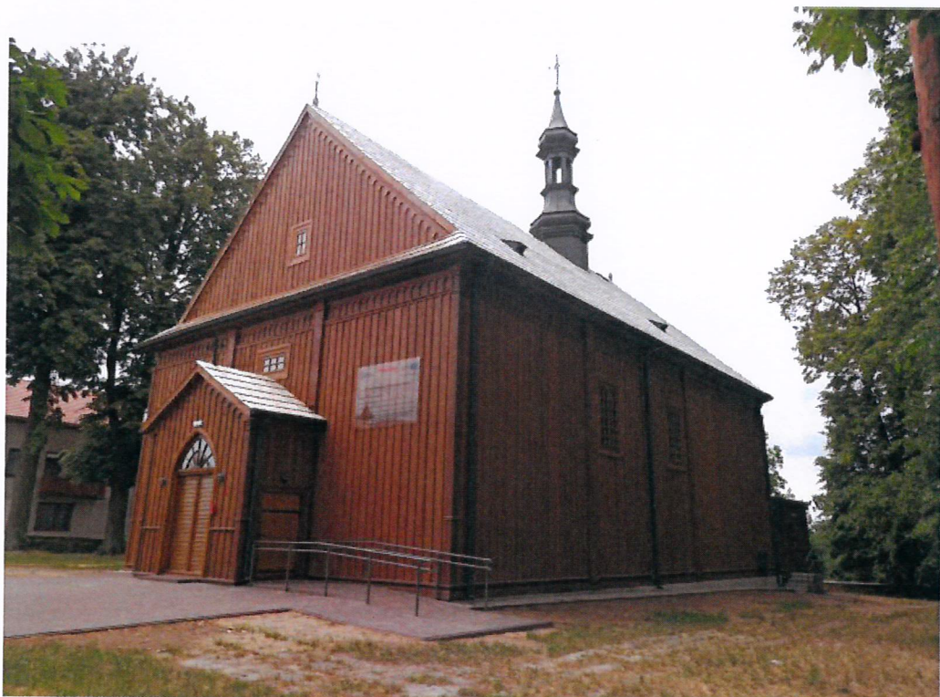
Regionalny Ośrodek Kultury

Do najciekawszych obiektów zabytkowych możemy zaliczyć kościół drewniany w Rozbitym Kamieniu obecnie pełniący funkcję Regionalnego Ośrodka Kultury i Pałac w Patrykozach obdarzony mianem