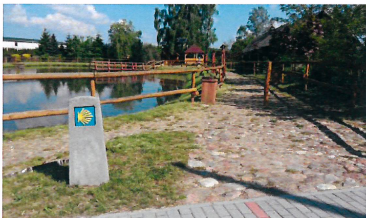
Kowiesy zbiornik wodny