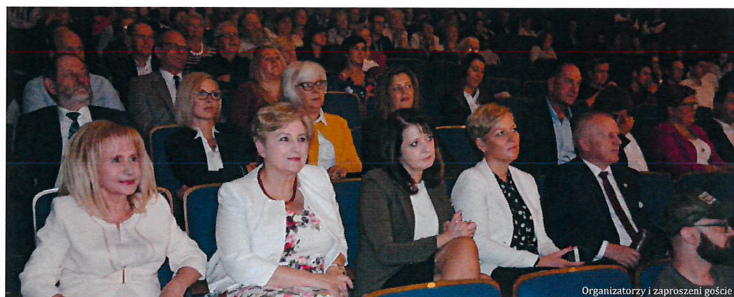
Organizatorzy i zaproszeni goście