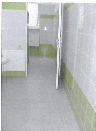
mianę nawierzchni podłogi w ciągu komunikacyjnym

cie budżetu na remont łazienek i podłogi w budynku szkoły podstawowej, co w efekcie uniemożliwiło jej wykonanie zadania. Jednak rodzice dzieci uczęszczających do szkoły w Wierzbnie, zbulwersowani decyzją radnych, postanowili działać i wystąpili z petycją do Rady Gminy Wierzbno o zabezpieczenie środków finansowych w budżecie gminy na wykonanie remontu łazienek oraz wy-