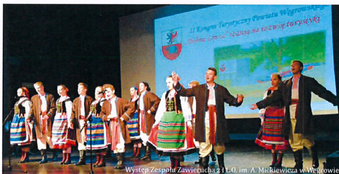
Występ zespołu Zawierucha z I.L.O. im. A. Mickiewicza w Węgrowie