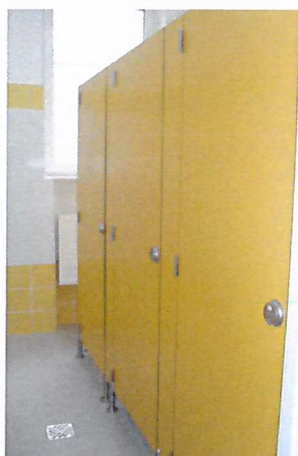
na parterze i w szatni w Szkole Podstawowej. Do