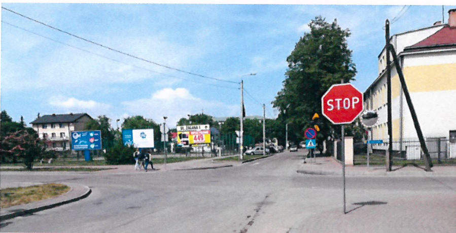
Przebudowa ul. Mickiewicza w Węgrowie