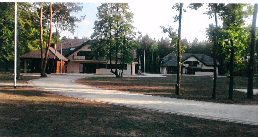
Dom Dziecka Julin w Kaliskach

Starostwo Powiatowe w Węgrowie ul. Przemysłowa 5, 07-100 Węgrów tel. 25 792 26 17, 25 740 92 00 starosta@powiatwegrowski.pl www.powiatwegrowski.pl pon.-wt.-czw. 8.00-16.00 śr. 8.00-17.00 | pt. 8.00-15.00