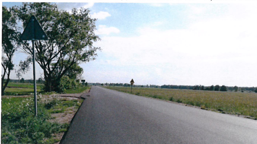
Przebudowa drogi powiatowej nr 2247 W Kąkuszyń (granica powiatu) - Wierzbno - Roguszyn - Korytnica - Paplin

zacje zadania związanego z przebudową drogi powiatowej Pogorzelec - Barchów w gminie Łochów. Dofinansowanie pochodzi z budżetu Województwa Mazowiec-